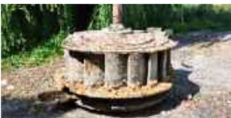
l'ancienne turbine retrouvée

Pour réduire le réchauffement climatique, il faut faire baisser les émissions de gaz à effet de serre de 40 à 70% d'ici à 2050. Cet impératif formulé par les experts internationaux ont rendu public, en avril 2014, les différentes pistes pour y parvenir : gestion des terres agricoles, séquestration du CO 2 et soutien aux énergies renouvelables. Tout cela a déjà un coût qui rend les énergies renouve-