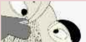
hai Puka (France - 2010)

Une petite fille découvre le monde à travers une feuille.