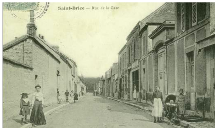
Boucherie et bureau de tabac