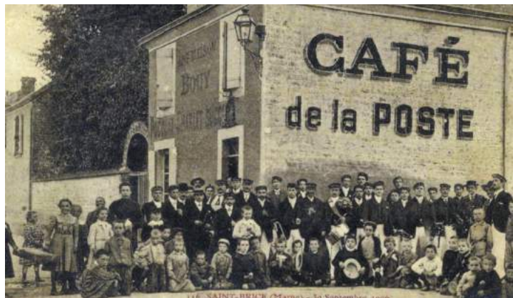
Café de la Poste le 30 septembre 1906 (Actuel Saint-Fiacre)