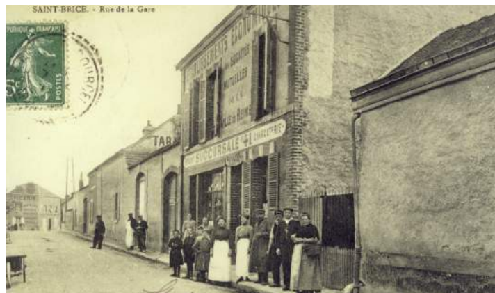
Etablissements Economiques d'alimentation