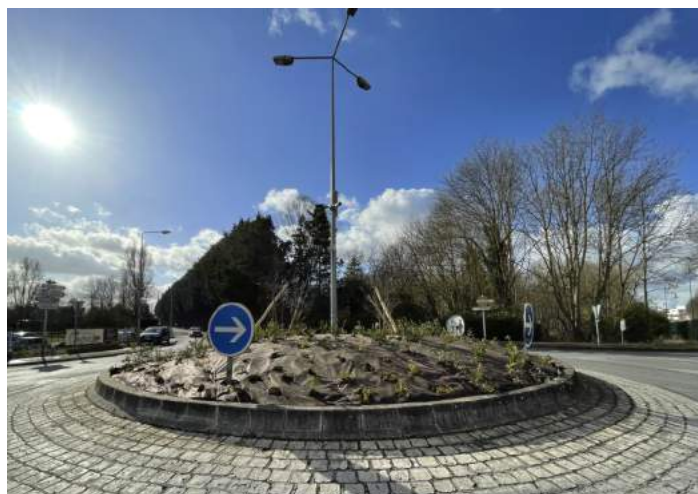
Fleurissement du rond point Libération / Quatres routes