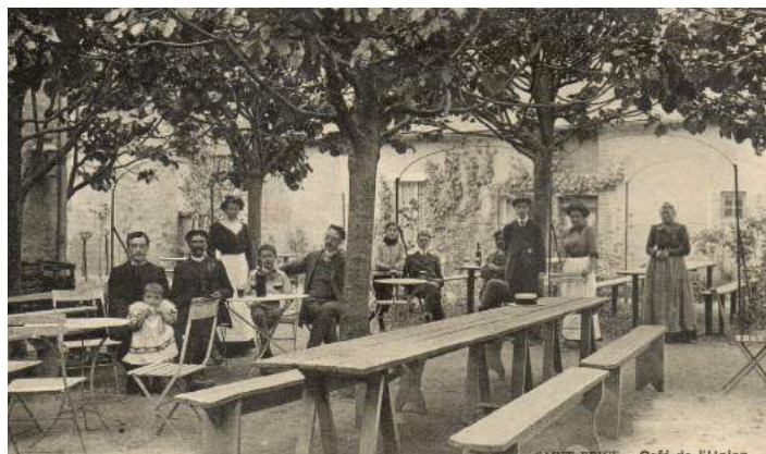
Café de l'Union cour intérieure