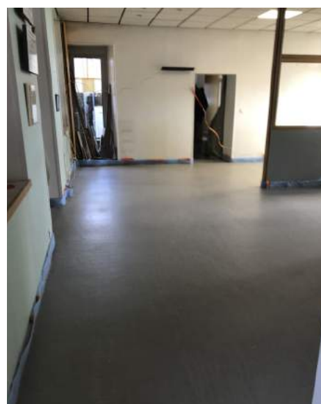
Les travaux de rénovation de l'accueil de la Mairie avancent à grands pas. La nouvelle dalle a été coulée. En attendant le carlage.