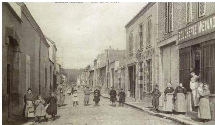
Boucherie « Weyand » et Café de l'Union