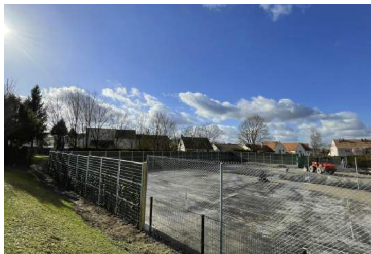
Les nouveaux murs antibruit ont été installés au niveau des terrains de tennis au parc du Mont Hermé