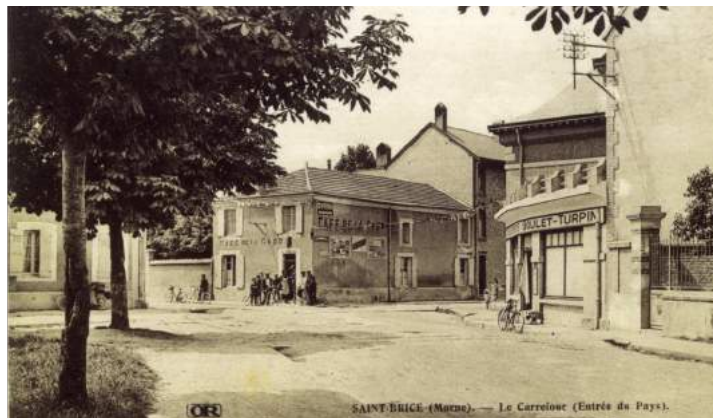
Café de l'Union cour intérieure