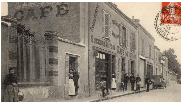
Café de l'Union et Société Rémoise de l'épicerie et charcuterie