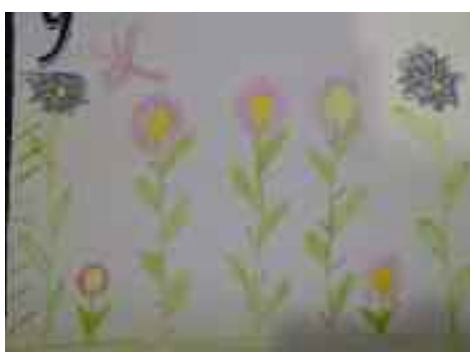
2 ème prix : Léa Chignola