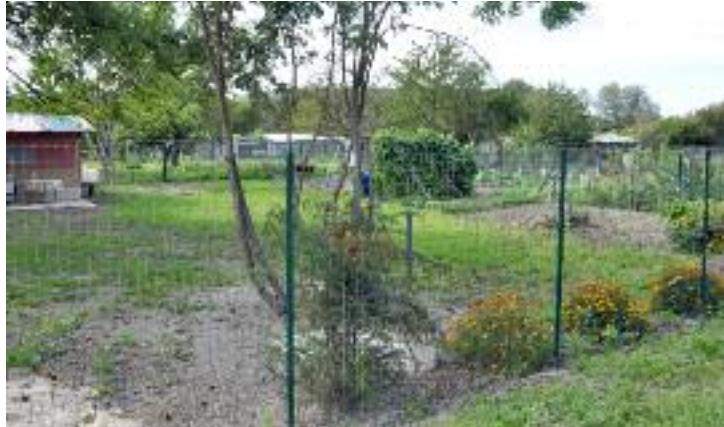
jardin en cours d'aménagement chemin des Marais

Notre commune est propriétaire de plusieurs friches et souhaite les remettre en valeur. Une première expérience est en cours sur le chemin des Marais. Il reste au futur