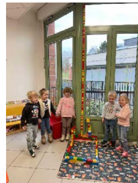
La tour infernale