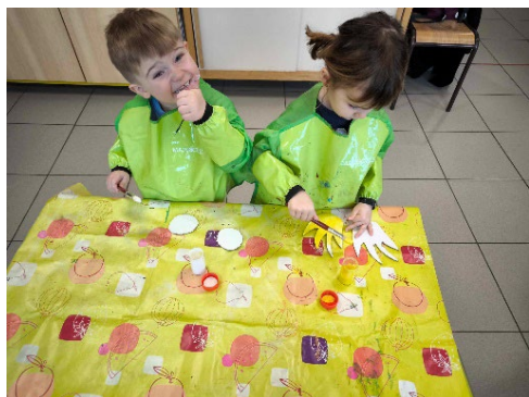
Les flammes de Smog ne brûlent pas !

Surprise pour les enfants : Un dragon a fait son nid dans le centre social. Il leur a fallu lui trouver un ami, qui d'ailleurs vole encore aux alentours de la salle rose. Les enfants lui ont aussi créé une « géante tour », pour qu'il puisse se reposer après de longs vols. L'intervenant de « Bricks four Kidz » est venu leur prêter mainforte. Enfin, afin que le dragon Smog puisse se nourrir, les enfants lui ont préparé les mets les plus fins du royaume.