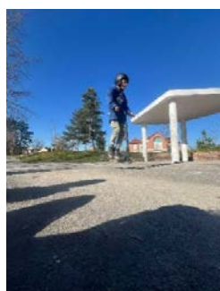
ça décolle la trot'

Les enfants pourront choisir et s'inscrire sur les projets de leur choix les mercredis 23 et 30 avril.