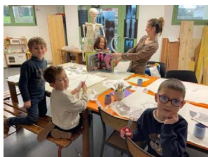
Le corps humain dans tous ses états