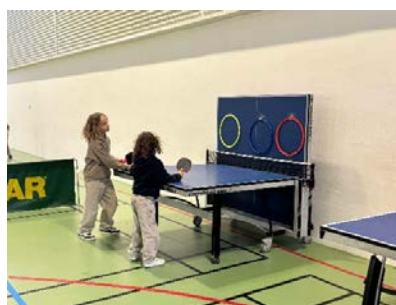
Initiation tennis de table