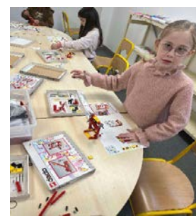
Pas si facile les Lego techniques !