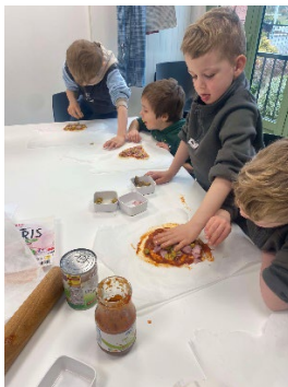
La pizza de Smog le Dragon