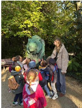
« À la recherche du lion égaré au parc de la mariée »

Presque deux semaines de beau temps pour profiter des extérieurs qu'offre la commune. Des jeux d'enquêtes, d'énigmes, d'orientation et de chasse aux objets ou à l'homme selon les âges ont pu être organisés grâce à cet été indien. Halloween s'est lentement et sournoisement glissée la seconde semaine dans les activités des enfants et ceci à leur plus grande joie !