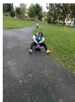
« Ça roule pour les maters, et pas que pour eux ! »