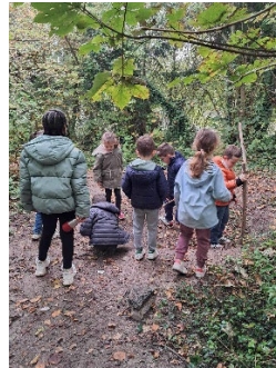
« En avant pour des fouilles archéologiques »