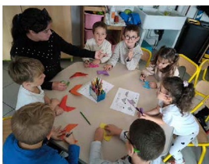
Origami, même en maternelle !