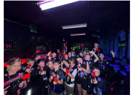
« Après toutes ces épreuves, c'est au Laser Game qu'on se défoule ! »