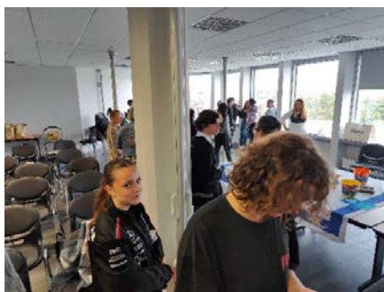
Concours Innov Jeunes