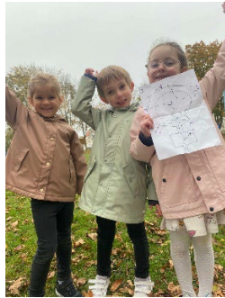
« La carte au trésor »