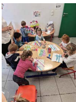
Arts plastiques en maternelle

À la demande des enseignants, nous avons élaboré tout un programme d'activités pour nos chérubins qui puisse compléter ou approfondir les apprentissages scolaires. Les arts plastiques sont (et seront) toujours de mise par la découverte de techniques ou d'artistes permettant aux enfants de développer des notions multiples, comme les formes, l'espace, la couleur la matière et entre autres différents supports pour arriver à une production artistique. La découverte de l'environnement sensibilise les enfants au monde qui les entoure. Quoi de mieux que le glanage et l'exploration pour observer les plantes et les petites bêtes automnales ! Enfin les déplacements en tricycles et autres engins roulants sont propices aussi bien pour les plus petits que pour les plus grands à gérer leurs déplacements dans un espace donné...Attention cette activité peut causer des maux de jambes si le bolide n'est pas adapté à la taille de l'adulte !