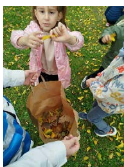
« Promenons-nous dans les bois... »