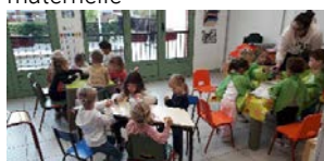
Tous ensemble dans la créativité