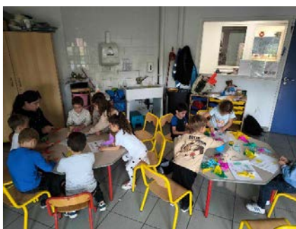
Petites expériences magiques et scientifiques