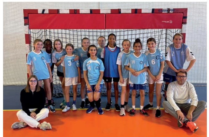
Les U13 féminines.

Samedi 6 mai. – 15h45 : U18 région vs Châlons ; 17h45 : Excellence vs Bogny ; 20h : N2 vs Dunkerque ; salle parquet 17h : U13 (2) vs Montier-en-Der Dimanche 7 mai. – 11h : Saint-Brice (3) – Bazancourt ; 14h : U9 (1) vs Ay ; salle parquet 10h : U11 (1) vs Reims CH Samedi 13 mai. – 15h45 : U18 (F) vs Alliance Meuse ; 17h45 : U15 Elite : Entente Marne – Strasbourg Sud ; 20h : N2 vs Saint-Ouen l'Aumône ; salle parquet 17h : U11 (2) vs Vitry Dimanche 14 mai. – 14h : U11 (1) vs Tinquieux/Gueux ; 16h : U13 (F) vs Épernay/Ay Samedi 20 mai. – U13 (F) vs Vitry Dimanche 21 mai. – U13 (1) vs Vitry Samedi 27 mai. – Excellence vs Chevillon