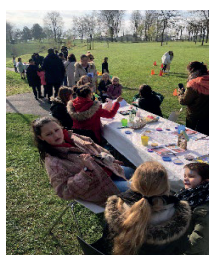
Groupe des ados