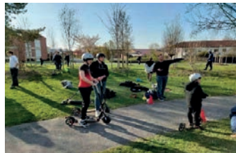
Explication de l'atelier