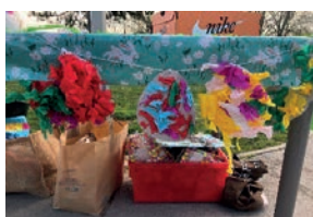
Décoration de la chasse aux œufs

Merci à tous les enfants du périscolaire pour leur implication sur les décorations de cette matinée.