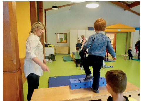
Atelier Saut à la volée

Étant également animateur, on peut imaginer qu'être éducateur est une approche différente ?