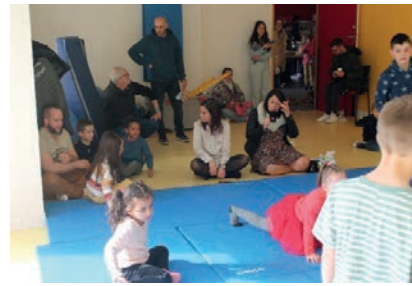
Les familles au tapis