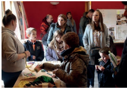
Un peu de magie