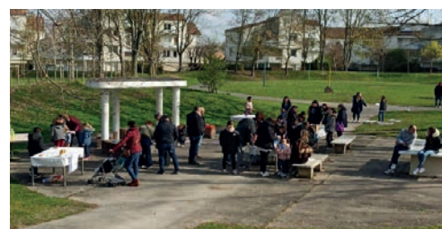
Vue d'ensemble des activités