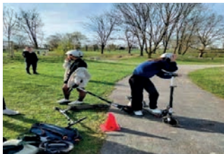
Prise en main du matériel

L'activité a attiré les curieux, petits et grands. Les trottinettes électriques étaient réservées aux plus de 12 ans et pour les plus jeunes des trottinettes adaptées ont été mises à disposition. Un parcours a été mis en place autour du parc avec une initiation au fonctionnement de la trottinette électrique. Tous ont partagé un bon moment dans une ambiance conviviale et ont pu se mesurer au (pas si simple) parcours pour tenter de réaliser le meilleur chrono.