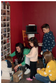
artistes en herbe

La prochaine restitution se déroulera lors de la fête du centre social, le samedi 24 juin, non pas le matin, mais l'après-midi.