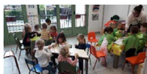
Tous ensemble dans la créativité

Les activités éducatives commenceront à la mi-octobre, vivement qu'elles débutent !