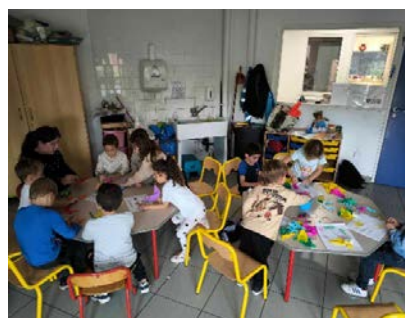
Petites expériences magiques et scientifiques