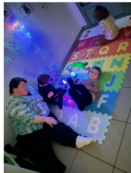
Atelier relaxation avec les petites

Un beau programme en perspectives pour accompagner les enfants tout au long de l'année.