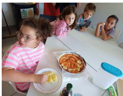
Que mange-t-on pour le goûter ?