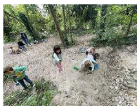
Mais qu'il y a-t-il sous la terre ?

Cependant avant d'organiser ces ateliers les enfants ont vécu un mois de loisirs pédagogiques dont voici quelques photos :