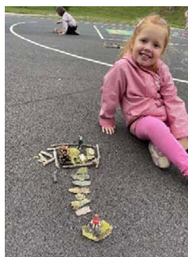
Un pont pour mon playmobil