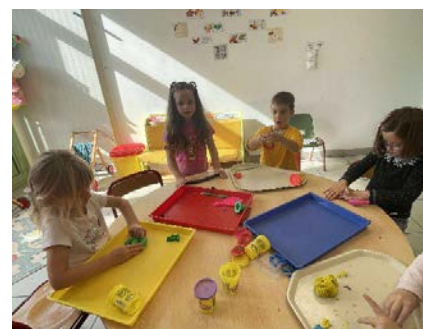
La patouille, nous on adore !