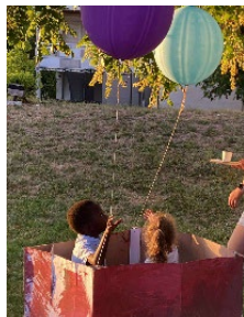
Le tour du monde en 80 jours Trésors de l'île mystérieuse