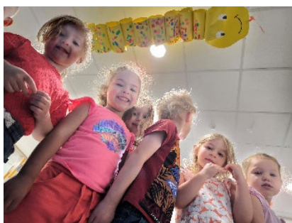
Le monstre marin de 20 000 lieues sous les mers

La parole aux plus petits : Les animations proposées par les enfants :