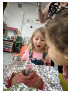
L'expérience du volcan

Pour conclure, voici le mot de la fin, extrait du livre d'Or : « Nous aimons trop bien le CLAE, vivement que l'on y revienne ! »