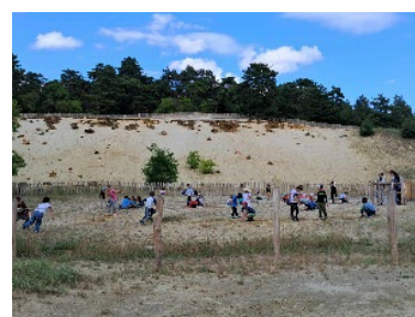
Voyage au centre de la sablière

La parole aux plus petits : Les animations proposées par les enfants :