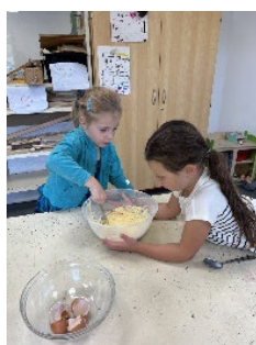
Préparation de gâteaux pour la veillée famille