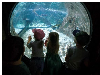
20 000 lieues sous les mers...

Et pour rêver, jouer et explorer : Voyages du mois dans les mondes de Jules Verne :